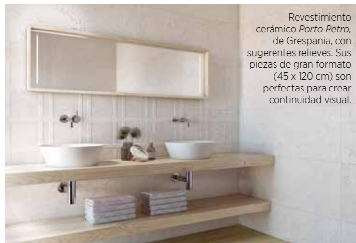
Revestimiento cerámico Porto Petro , de Grespania, con sugerentes relieves. Sus piezas de gran formato (45 x 120 cm) son perfectas para crear continuidad visual.