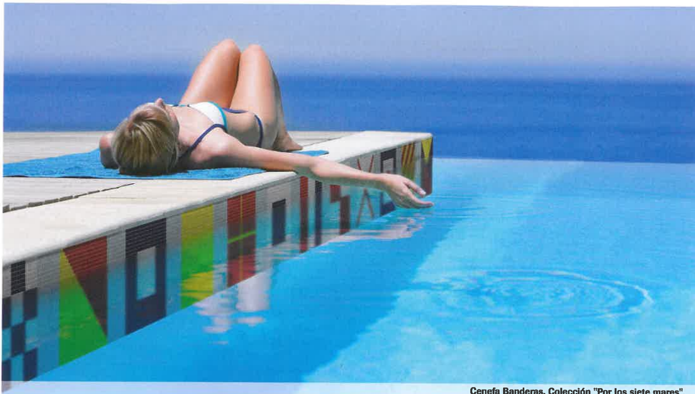
Cenefa Banderas, Colección "Por los siete mares".